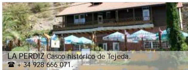
LA PERDIZ Casco histórico de Tejeda. ☎ + 34 928 666 071.