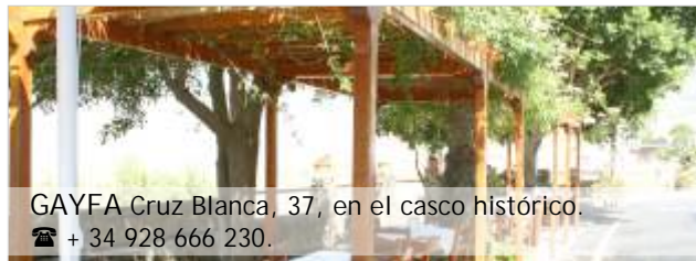
GAYFA Cruz Blanca, 37, en el casco histórico. ☎ + 34 928 666 230.