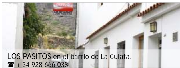
LOS PASITOS en el barrio de La Culata. ☎ + 34 928 666 038.