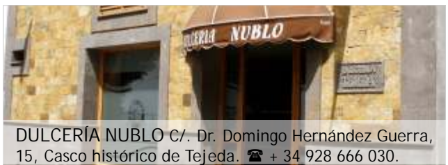
DULCERÍA NUBLO C/. Dr. Domingo Hernández Guerra, 15, Casco histórico de Tejeda. ☎ + 34 928 666 030.