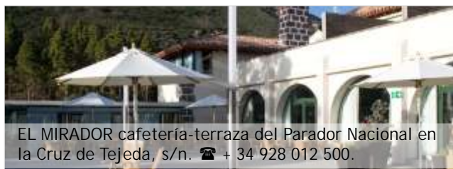
EL MIRADOR cafetería-terraza del Parador Nacional en la Cruz de Tejeda, s/n. ☎ + 34 928 012 500.