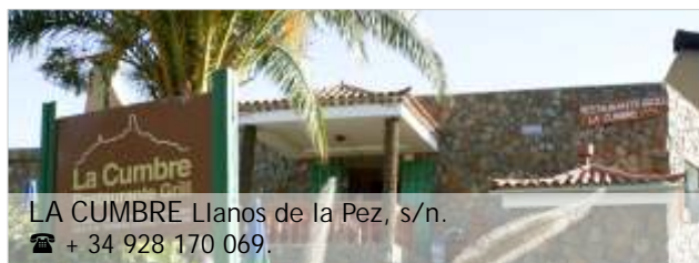
LA CUMBRE Llanos de la Pez, s/n. ☎ + 34 928 170 069.