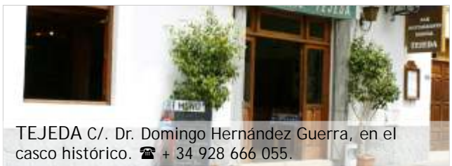
TEJEDA C/. Dr. Domingo Hernández Guerra, en el casco histórico. ☎ + 34 928 666 055.