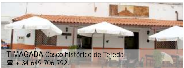
TIMAGADA Casco histórico de Tejeda. ☎ + 34 649 706 792.