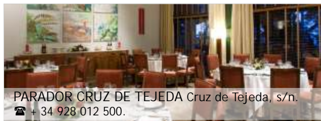
PARADOR CRUZ DE TEJEDA Cruz de Tejeda, s/n. ☎ + 34 928 012 500.