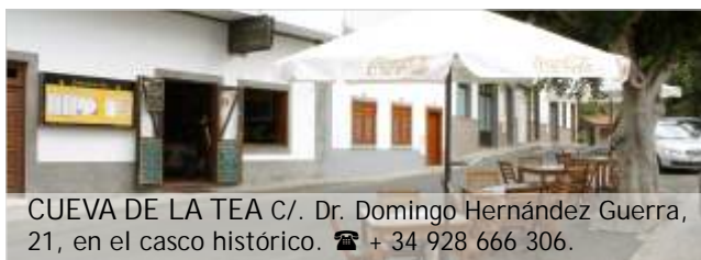
CUEVA DE LA TEA C/. Dr. Domingo Hernández Guerra, 21, en el casco histórico. ☎ + 34 928 666 306.