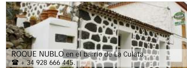
ROQUE NUBLO en el barrio de La Culata. ☎ + 34 928 666 445.