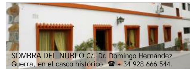
SOMBRA DEL NUBLO C/. Dr. Domingo Hernández Guerra, en el casco histórico. ☎ + 34 928 666 544.