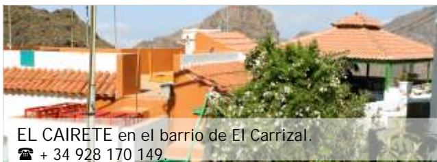
EL CAIRETE en el barrio de El Carrizal. ☎ + 34 928 170 149.